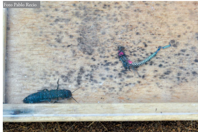
Figura 1: Restos de juvenil de I. cyreni (derecha) y adulto de O. olens (izquierda). Fotografía tomada en septiembre de 2018.

En este artículo mostramos por primera vez documentación gráfica de restos de un juvenil de lagartija carpetana devorado por el coleóptero Ocypus olens (Müller, 1764) (Coleoptera: Staphylinidae) (Figura 1). La fotografía fue tomada en la Estación Biológica de “El Ventorrillo” (MNCN-CSIC) (Sierra de Guadarrama) en septiembre de 2018 durante la realización de un experimento de discriminación química. Los juveniles eran recién nacidos que se encontraban alojados al aire libre en series de cinco terrarios (73 x 51 x 42 cm) interconectados, con un refugio de madera por terrario y comida y agua ad libitum . Los terrarios se encontraban protegidos con una red plástica de la posible depredación por aves.